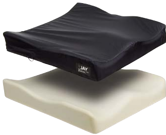
奥に切り欠き形状