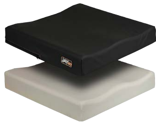
奥に切り欠き形状