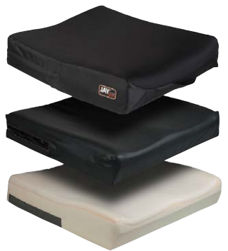
奥に切り欠き形状