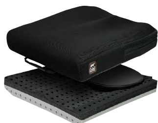
奥に切り欠き形状