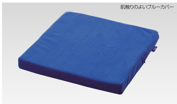
肌触りのよいブルーカバー

重 量：約0.9kg サイズ：厚み3.5×タテ40×ヨコ40cm 材質：エクスジェル、ウレタン