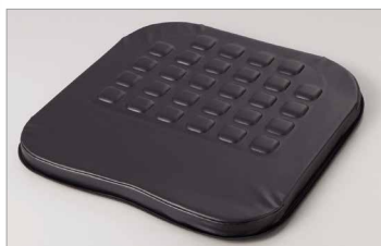
カバーをはずした状態