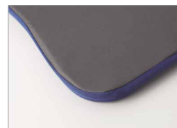
カバー裏面のすべり止め加工