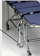
ストレッチャー 折りたたみ時

TY231-2 酸素ボンベ架 酸素ボンベ架 税込価格 21,780円(本体価格 19,800円) 酸素ボンベ架内径 105mm 酸素ボンベ架取付け時のストレッチャーの 全幅は約160mm広くなります。