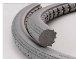
●ハイポリマータイヤ断面写真