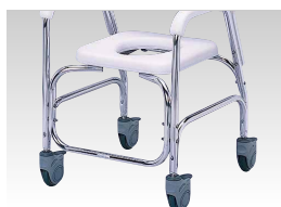
樹脂製キャスター TY535DXE