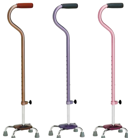
①ブラウン ②パープル ③ピンク