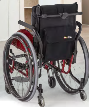
PHOTO / オプション仕様 フレームカラー：プレミアムレッド(オプション) オプション：ハードアルミハンドリム アルミサイドガード パイプアームサポート ノーパンクタイヤ エアリー 座クッション 参考重量：14.0kg(座クッション含まず) 参考価格：406,900円 (座クッション含まず・非課税)