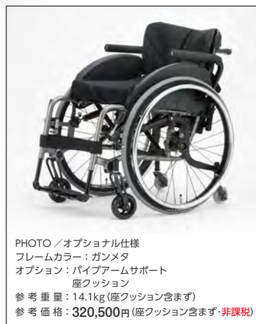
PHOTO / オプション仕様 フレームカラー：ガンメタ オプション：パイプアームサポート 座クッション 参考重量：14.1kg(座クッション含まず) 参考価格：320,500円(座クッション含まず・非課税)

PHOTO / オプション仕様 フレームカラー：プレミアムレッド(オプション) オプション：ハードアルミハンドリム アルミサイドガード パイプアームサポート ノーパンクタイヤ エアリー 座クッション 参考重量：14.0kg(座クッション含まず) 参考価格：406,900円 (座クッション含まず・非課税)